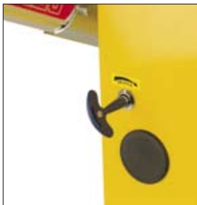
Sblocco manuale esterno facile e intuitivo Einfache und intuitive externe Entriegelung von Hand