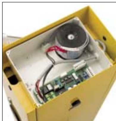
Quadro di comando separato dalle parti meccaniche Von den mechanischen Teilen getrennte Steuer- und Schalttafel