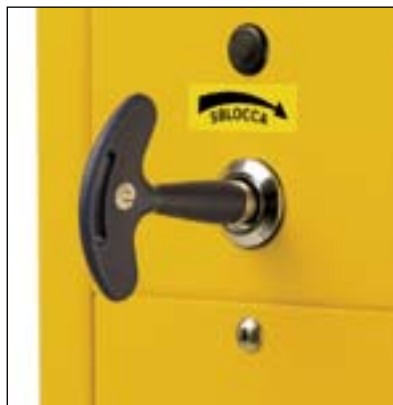
Sblocco manuale con chiave personalizzata Entriegelung von Hand mit personalisiertem Schlüssel