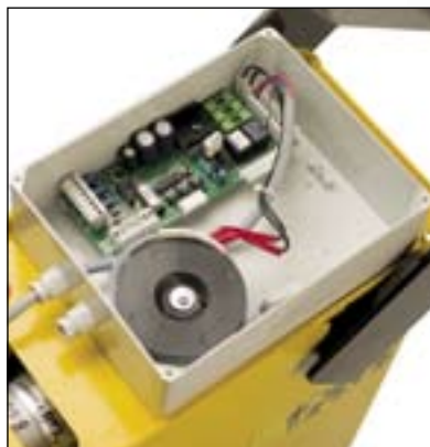
Programmazione e regolazioni semplici e veloci Einfache und schnelle Programmierung und Einstellungen